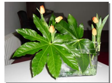
チューリップのモダンなデザイン