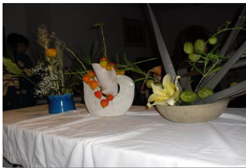
花器の種類も豊富