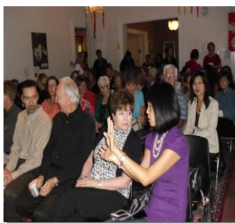
会場を埋め尽くした参加者